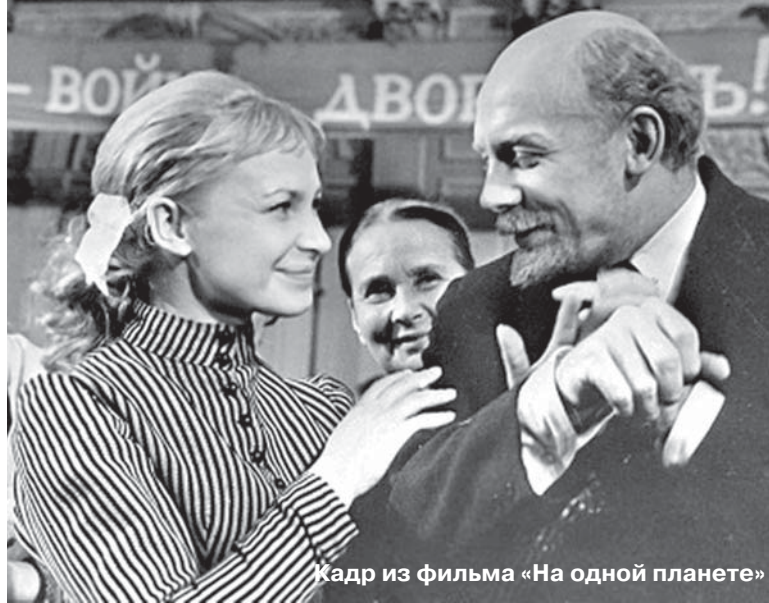
Кадр из фильма «На одной планете»

Актер искал свидетельства о его характере в литературе,